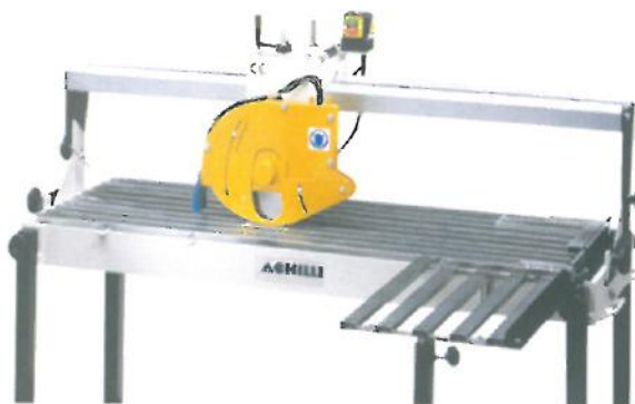
Table latérale (optionnelle)